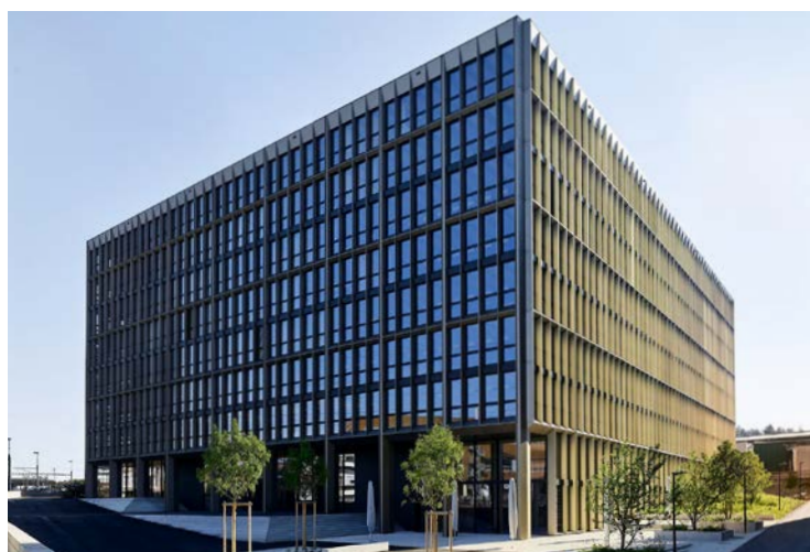
Nouveau bâtiment certifié SNBS « Platine », Minergie-P-ECO et Gutes Innenraumklima (label pour un bon climat intérieur) à l'Eichenweg 5 à Zollikofen

Le standard SNBS intègre les trois dimensions du développement durable, à savoir société, économie et environnement. Il évalue notamment la protection du climat et l'énergie, la préservation des ressources et la protection de l'environnement, le cycle de vie, l'économie régionale, le bien-être et la santé ainsi que la nature et le paysage.