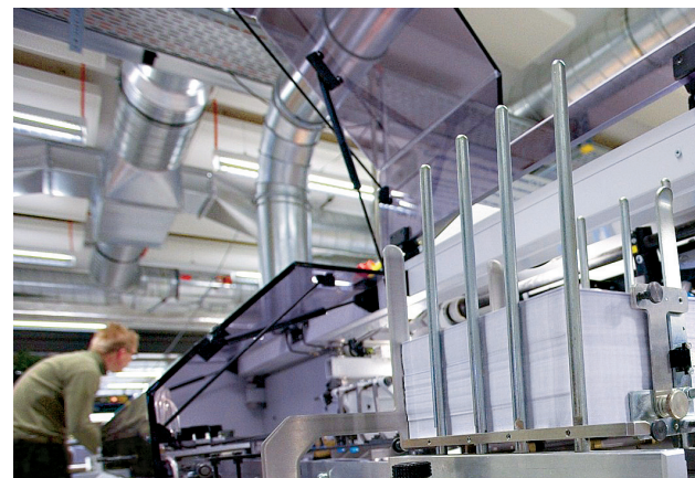
Imbustamento di lettere in serie

L'UFCL è il servizio centrale di pubblicazione dei dati, di stampa e invio dell'Amministrazione federale. Il suo compito consiste nell'elaborazione dei dati, nella programmazione di lettere in serie e nella pubblicazione di dati. L'UFCL deve anche assicurare la protezione dei dati. Esso commissiona complessivamente quasi 40 000 invii postali al giorno.