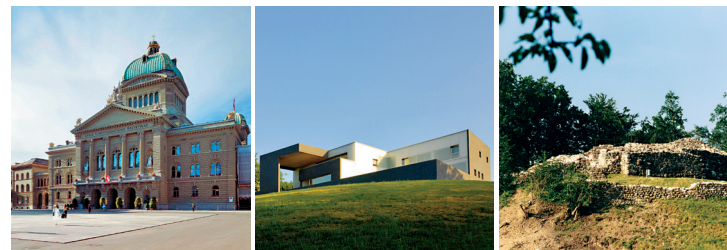
Palazzo del Parlamento

L'obiettivo strategico dell'UFCL è ridurre il numero degli edifici in locazione e mettere a disposizione gli spazi per quanto possibile in edifici di proprietà della Confederazione se ciò risponde al criterio dell'economicità. Grazie all'attuazione di una strategia globale, il portafoglio immobiliare dell'UFCL è gestito in modo ottimale.