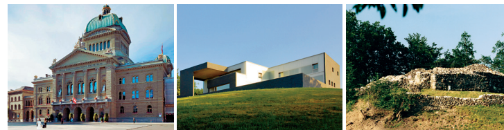
Palais du Parlement

L'OFCL vise à réduire le nombre de bâtiments pris en location et, pour autant que cela soit économique, à faire en sorte qu'une proportion aussi importante que possible des locaux mis à disposition se trouvent dans des bâtiments appartenant à la Confédération. Grâce à sa stratégie globale de portefeuille, l'OFCL gère son parc immobilier de manière optimale.