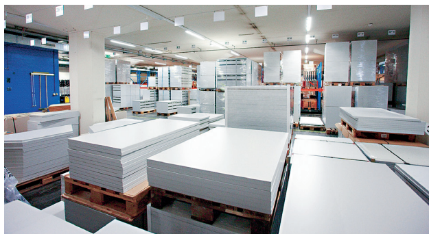
Entrepôt de meubles de bureau

La gestion des acquisitions au sein de l'OFCL est moderne, transparente et économique. Le but de la centralisation des achats de la Confédération est la concentration des commandes. Celle-ci permet à l'administration fédérale de bénéficier de conditions intéressantes et donc de prix plus avantageux. Par ailleurs, la sécurité juridique et la qualité des achats sont garanties.