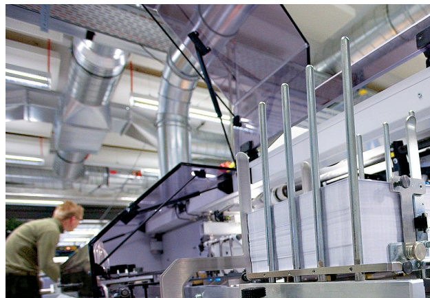
Mise sous pli de lettres envoyées en grandes quantités

L'OFCL est le service central de publication des données, d'impression et d'expédition de l'administration fédérale. A ce titre, il est chargé du traitement et de la publication des données ainsi que de la programmation des envois de lettres en grandes quantités. Il doit garantir la protection des données. L'OFCL expédie environ 40 000 envois postaux par jour.