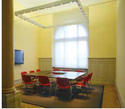
Salle de réunion