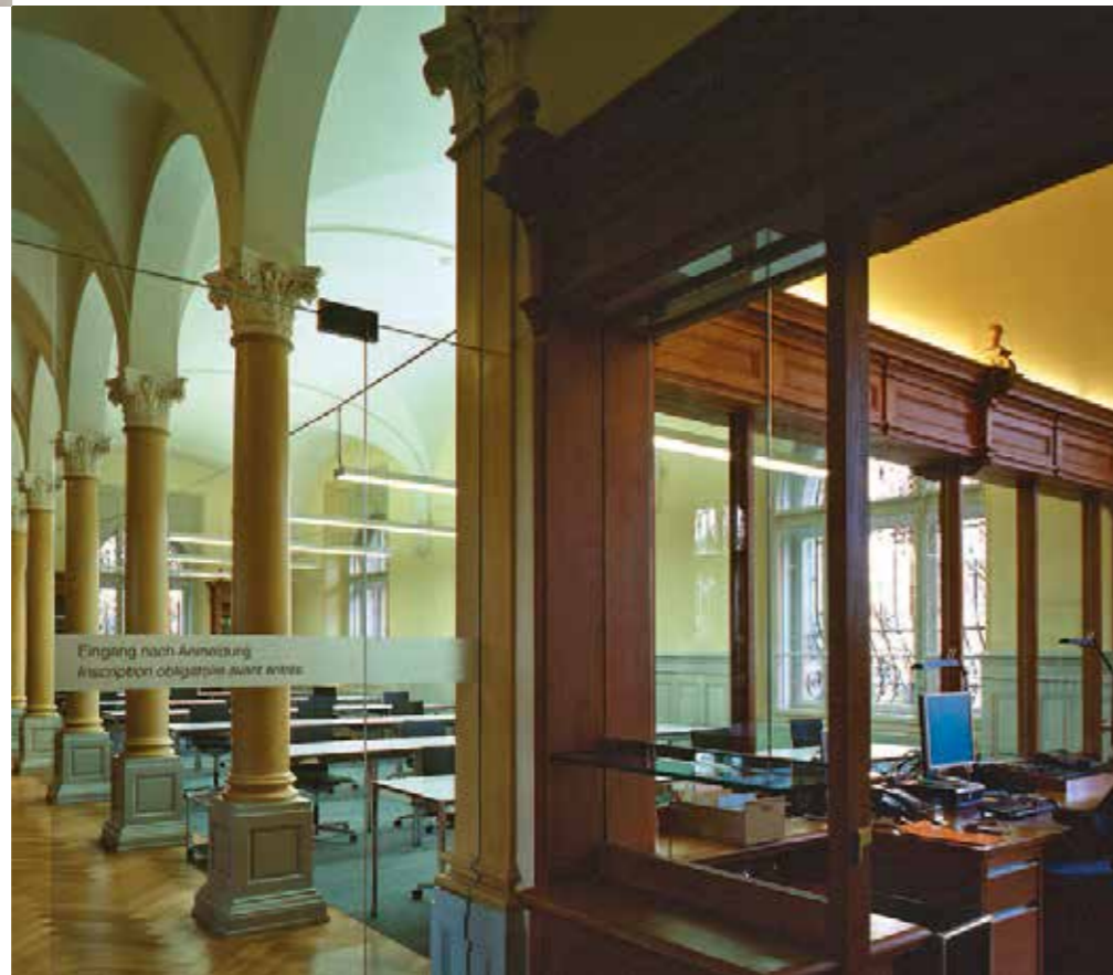
Salle de lecture 1