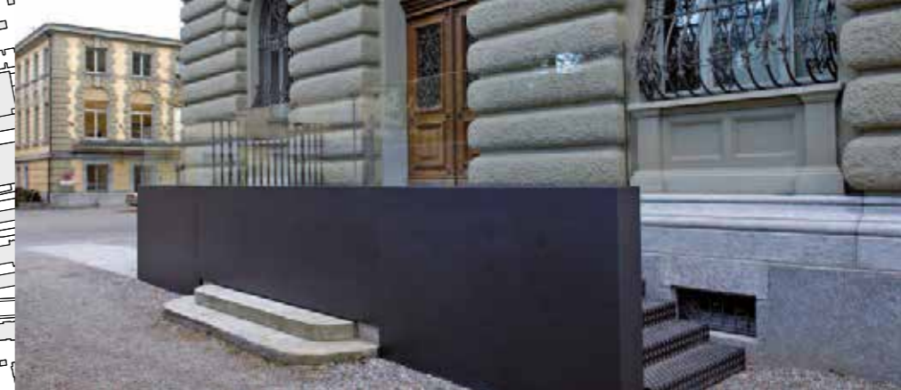
Nouvel accès destiné aux personnes à mobilité réduite