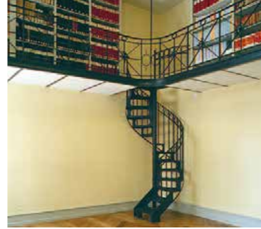
Salle de lecture 2