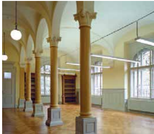
Salle de lecture 1