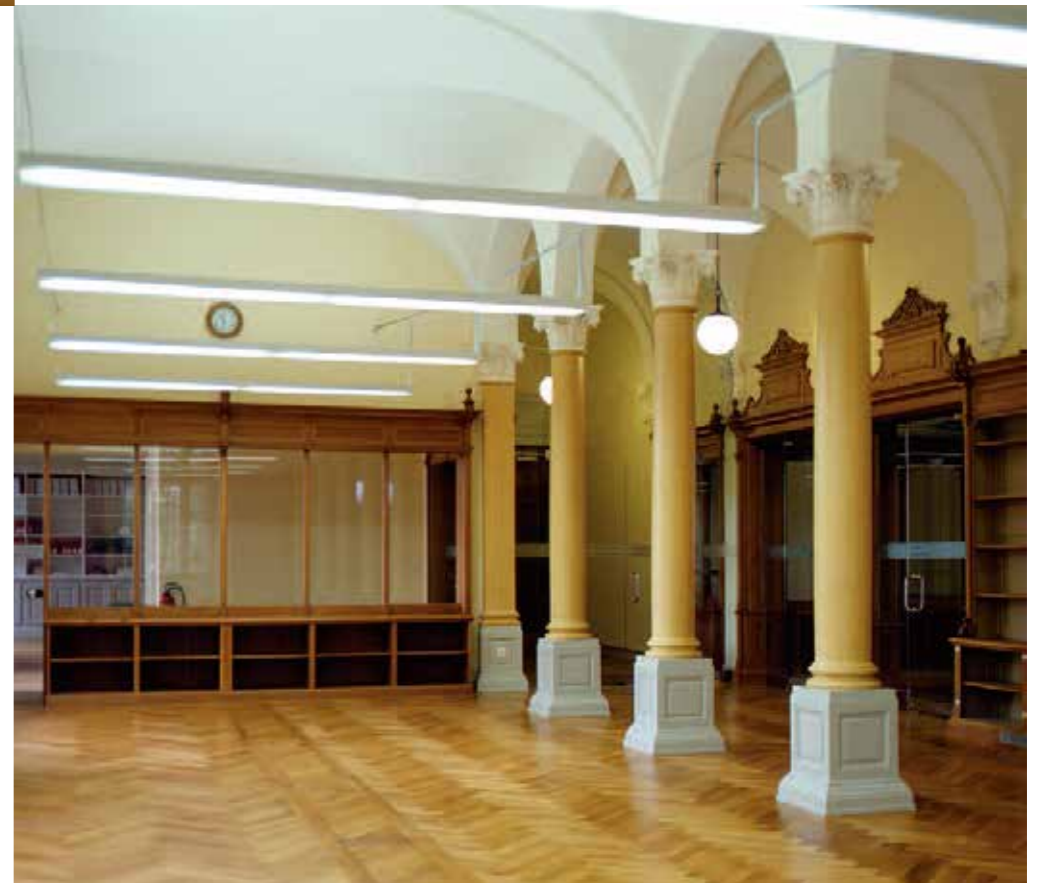
Salle de lecture 1