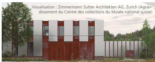
Visualisation : Zimmermann Sutter Architekten AG, Zurich (Agrandissement du Centre des collections du Musée national suisse)

Rendez-vous à la page 13 du rapport sur la durabilité 2023 de l'OFCL pour en savoir plus.